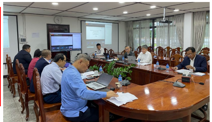
現地活動開始風景