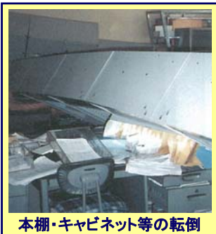
本棚・キャビネット等の転倒