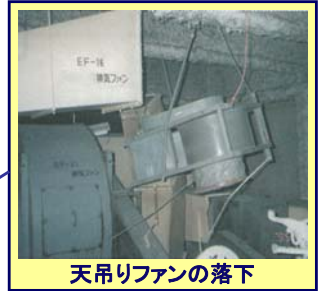
天吊りファンの落下