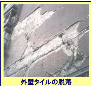
外壁タイルの脱落